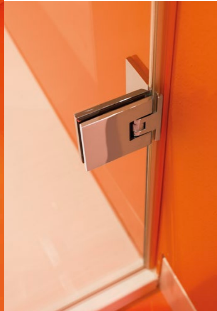
Zuverlässig: hochwertige Pendeltürbeschläge von KL-megla

Glasbau seinen Kunden in die Spiegelfläche integrierte LED-Lichtleisten anbieten und diese dabei in Form und Größe völlig frei platzieren. Auf Wunsch ist das Licht hierbei sogar dimmbar oder in der Farbgebung anpassbar. Aber auch eine Spiegelheizung kann den Komfort im Bad durch das Verhindern des Beschlagens deutlich steigern. Ergänzt werden können die Spiegelanlagen mit allen erdenklichen Anbauteilen wie etwa Schalter- und Steckdoseneinheiten, Beschallungssystemen, Kosmetikspiegeln und natürlich auch mit einer großen Auswahl an Aufsatzleuchten. Im Zusammenspiel mit der jahrelangen Erfahrung bei der Beratung und Montage von Spiegelanlagen sorgt das für eine hohe Beratungskompetenz und somit für ein sicheres Gefühl beim Kunden.